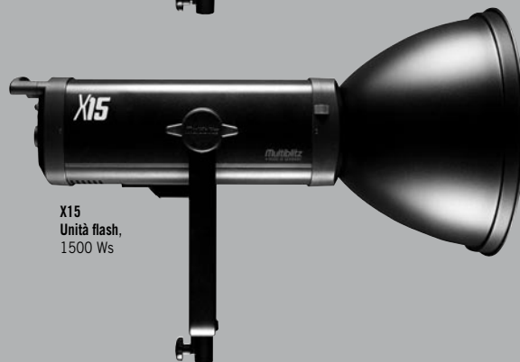
X15 Unità flash, 1500 Ws