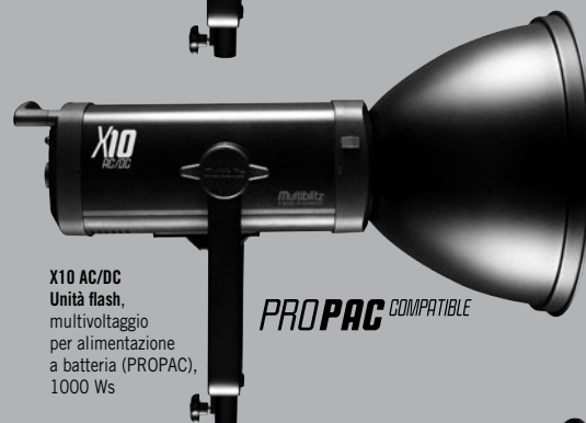
X10 AC/DC Unità flash, multivoltaggio per alimentazione a batteria (PROPAC), 1000 Ws