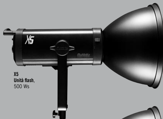
X5 Unità flash, 500 Ws